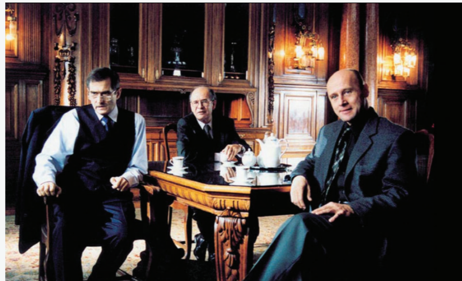
„Kariery Nikosia Dyzmy”